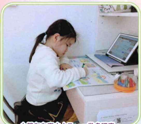
小朋友在家中上Zoom堂多認真。

老師利用不同的電子教學平台，如：Zoom和Nearpod等，以製作不同的小任務，讓幼兒在家仍能持續學習，並保持對學習的熱情，為迎接復課後所面對的新挑戰作好準備。